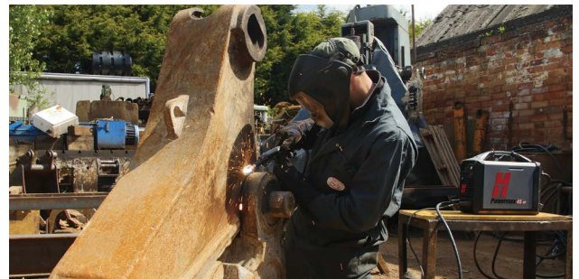
Техобслуживание и ремонт